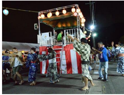
今年は踊りの参加者が増えたようです。