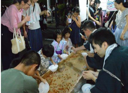
今ではなかなかできない「金魚すくい」

8.13 (月)、消防団詰所前の広場で伊深町納涼盆踊大会が開かれました。今年は「自治宝くじ」からの助成を受けて更新されたヤグラもお目見えし、例年以上のにぎわいのなか、「ライン音頭」や「ダンシング・ヒーロー」などの踊りが繰り広げられました。屋台では消防団、体育振興会、商工会などがそれぞれのテントで食材を提供したりしていました。また、グラウンドでは子供会育成会による花火も打ち上げられ、歓声が上がっていました。踊りの輪のまわりでは久しぶりに再会する友人を見つけて話が弾むなど、普段にはない活気が辺りにあふれていました。