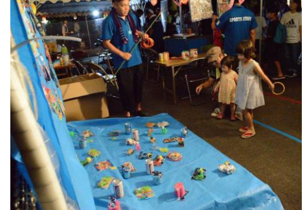
いつもチビッ子に大人気の「輪投げ」